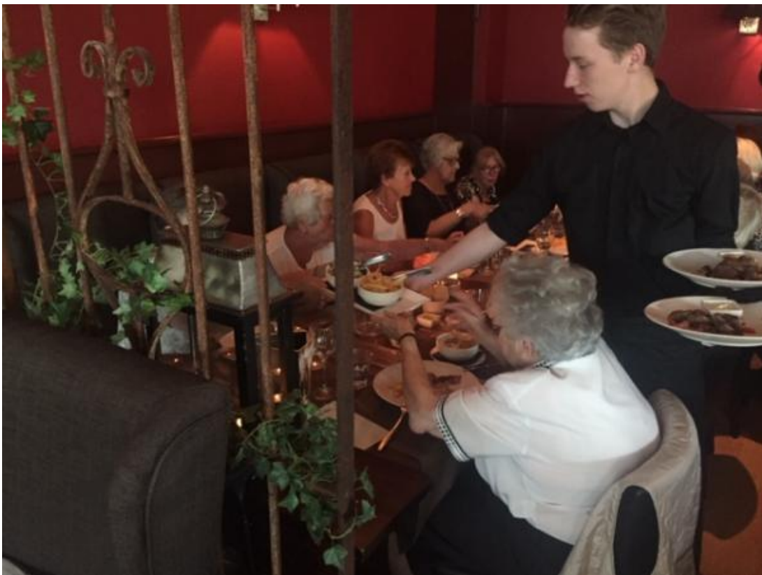
Het was vooral erg gezellig.